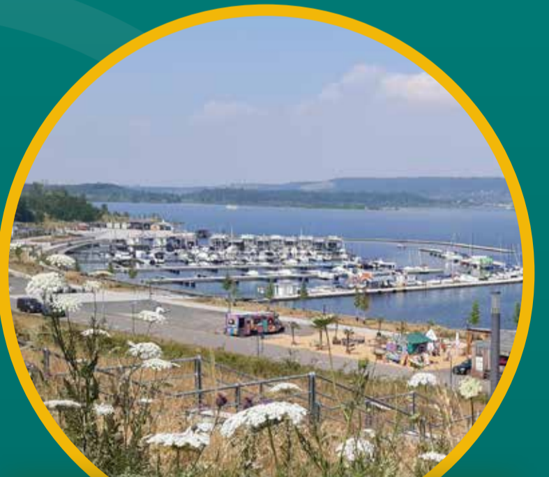
Marina Braunsbedra (Start)

Ziel ist die Wetterschutzhütte auf der Halbinsel. Dort ist für das leibliche Wohl gesorgt.